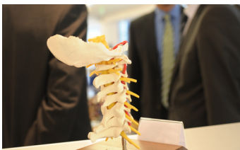
Die Attraktivität des Kongressprogramms lockt jährlich ca. 3.000 Teilnehmer nach Baden-Baden